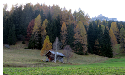
QRP Experiences UHF Val Comelico (BL) Italia 30.10.2022.